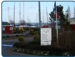
Camping naast de dijk