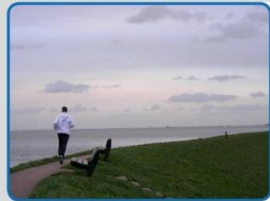
Recreatie op de dijk