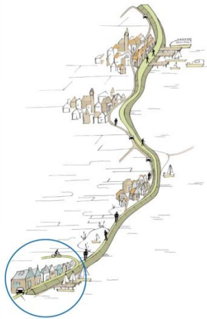
Het meest zuidelijke dorp langs de dijk: Durgerdam