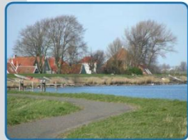
Huizen Uitdam tegen de dijk