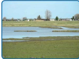
Natuur naast de dijk