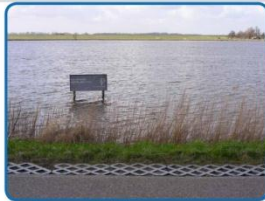
Natuur naast de dijk